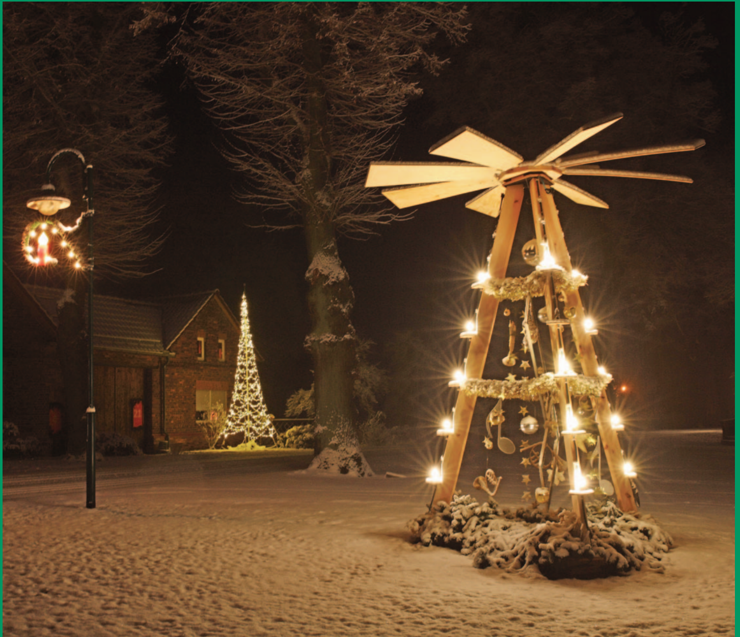
Lindenallee in Klein Partwitz, Dezember 2021